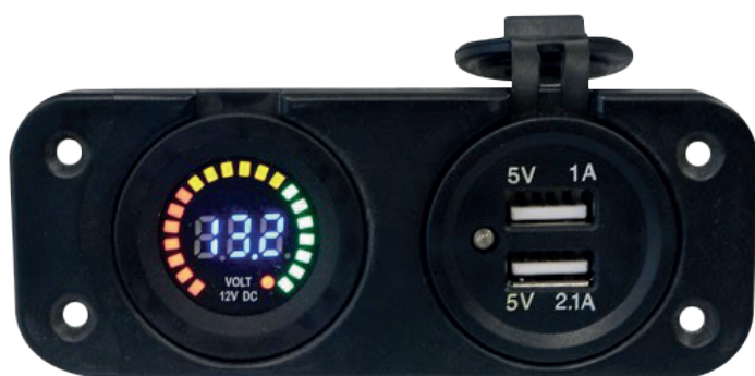
VLT-PRO + USB