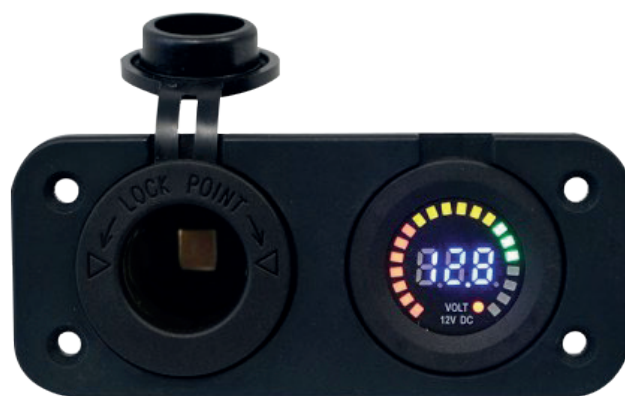
VLT-PRO + ACCU